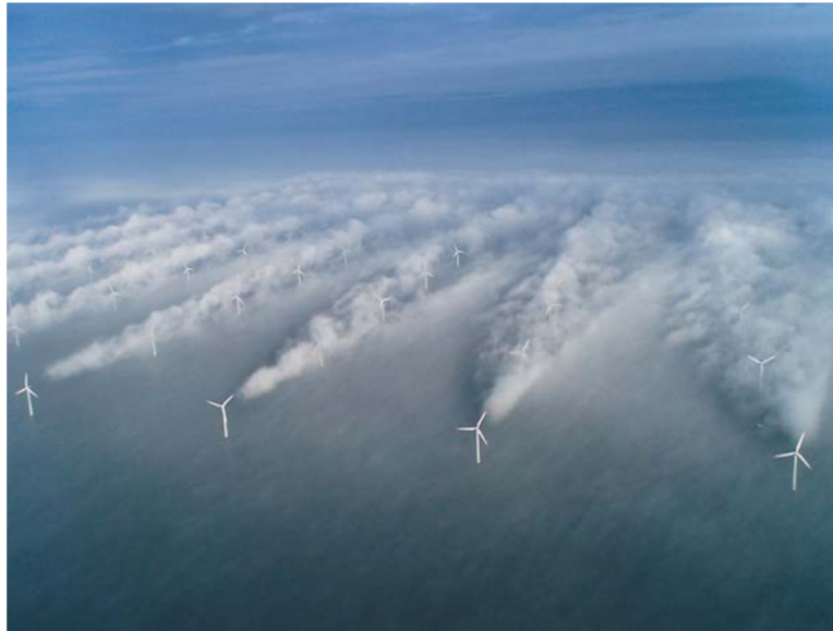
Abbildung 9: Aufnahme des Off-Shore-Windparks Horns Rev 1 von Vattenfall